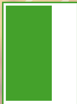
2/3 DI PAGINA 121 mm x 257 mm 2/3 PAGE