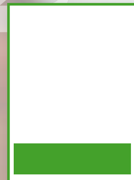
BOX PIÈ DI PAGINA 178 mm x 45 mm FOOTER